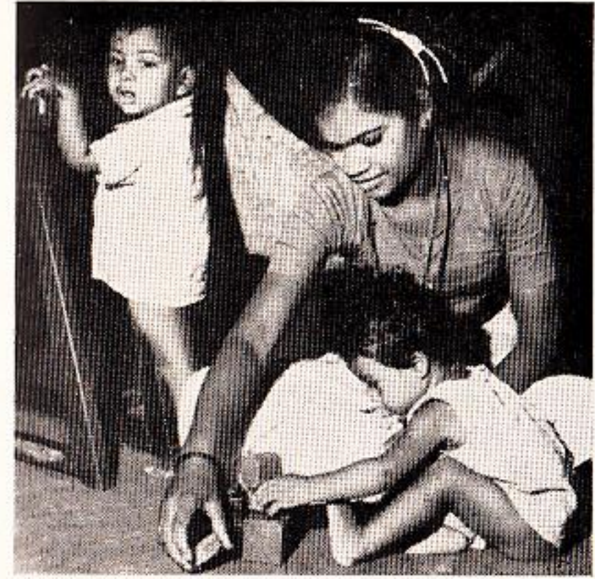
‘ शिक्षणाचे नवे युग बालकावर विश्वास ठेवील. ’ -मादाम मारिया मॉन्टेसोरी